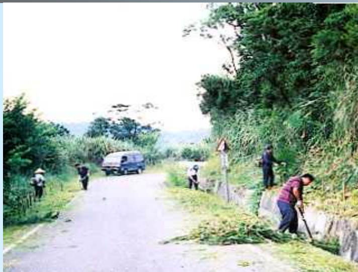
定期維護環境衛生