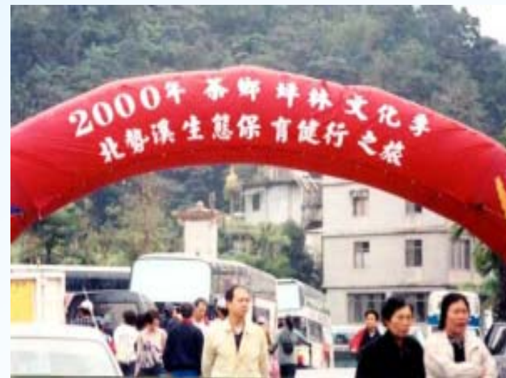
生態知性旅遊推廣