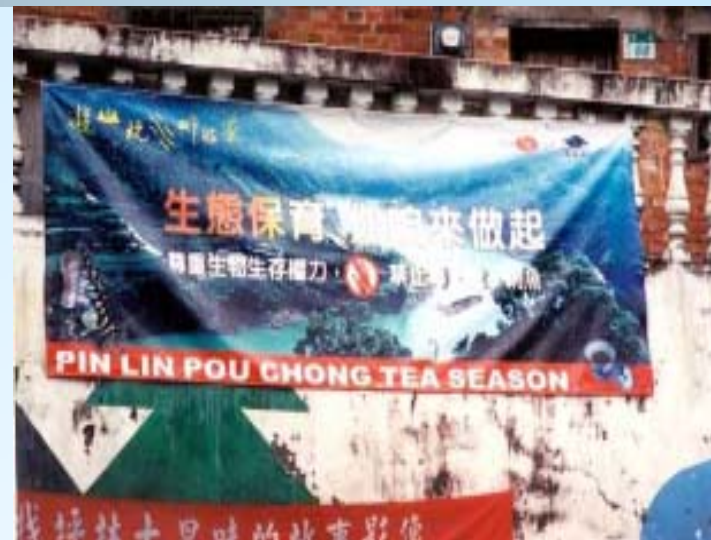
生態保育教育宣導