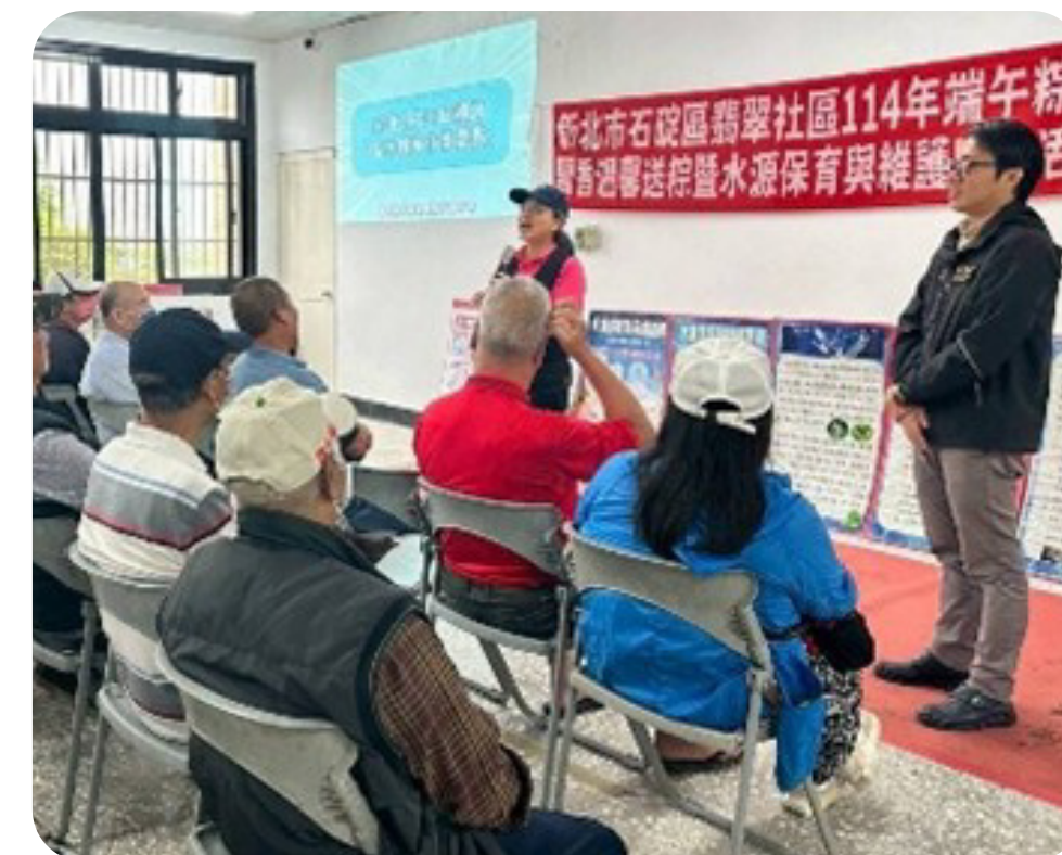
▲「北部粽好水×守護水源行動」主題展示與宣導