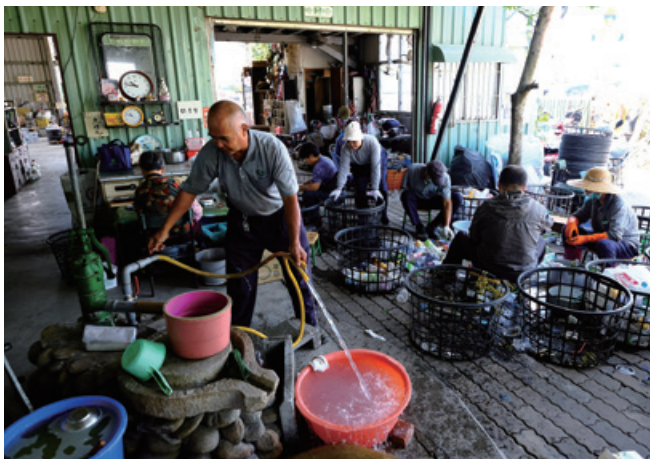
手壓式泵浦抽取雨水清洗地板