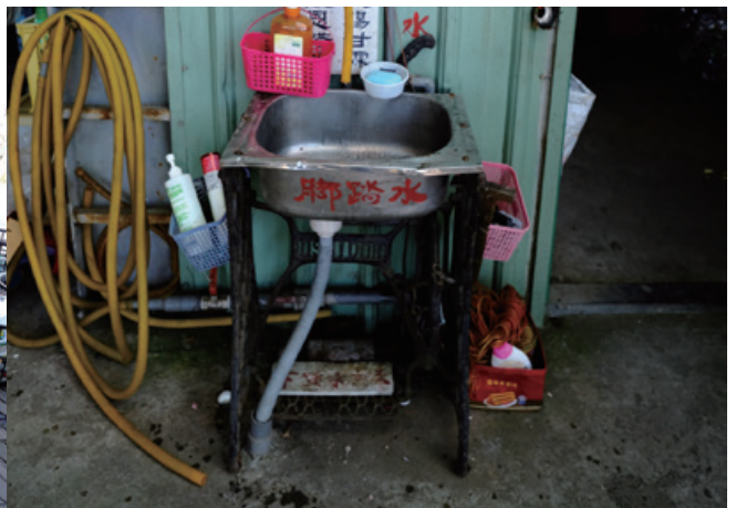
縫紉機改裝 - 腳踏式洗手台