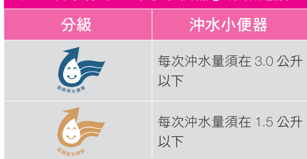
表 4 省水標章「沖水小便器」分級建議

新加坡小便斗沖水器每次沖水量在 0.5 公升至 1.5 公升之間，澳洲 5 及 6 顆星每次沖水量在 1 公升以下；香港小便器用具 1 級為 1.5 公升以下。建議省水標章沖水小便器金級參考新加坡 1 勾及香港 1 級標準，訂定為每次沖水量須在 1.5 公升以下，普級則維持每次沖水量須在 3 公升以下，省水標章「沖水小便器」分級建議詳表 4。