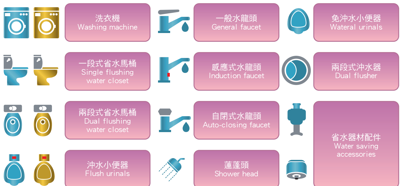
圖 1、省水標章 11 項產品

現行省水標章產品計 11 項，包括「洗衣機」、「一段式省水馬桶」、「兩段式省水馬桶」、「一般水龍頭」、「感應式水龍頭」、「自閉式水龍頭」、「蓮蓬頭」、「沖水小便器」、「免沖水小便器」、「兩段式沖水器」及「省水器材配件」。