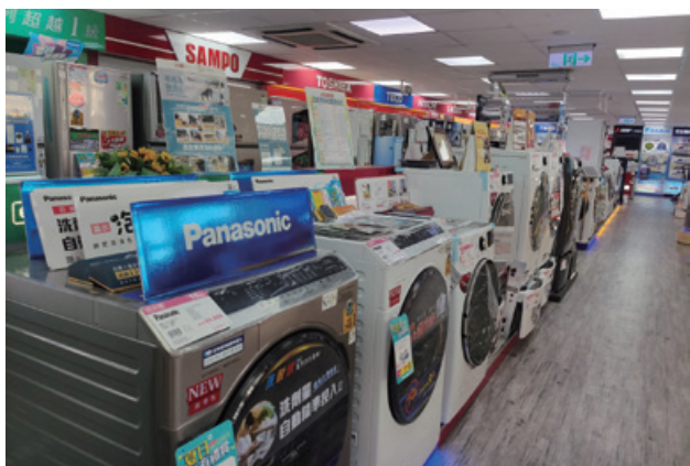
圖 6、洗衣機經銷商商品展示

網路應具省水標章稽查，主要為透過網路查察網路購物平台，查核其展售之應具省水標章產品是否符合規定。