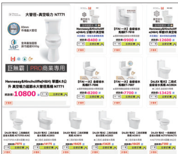
圖 7、馬桶網路平台展售示意圖

網路應具省水標章稽查，主要為透過網路查察網路購物平台，查核其展售之應具省水標章產品是否符合規定。