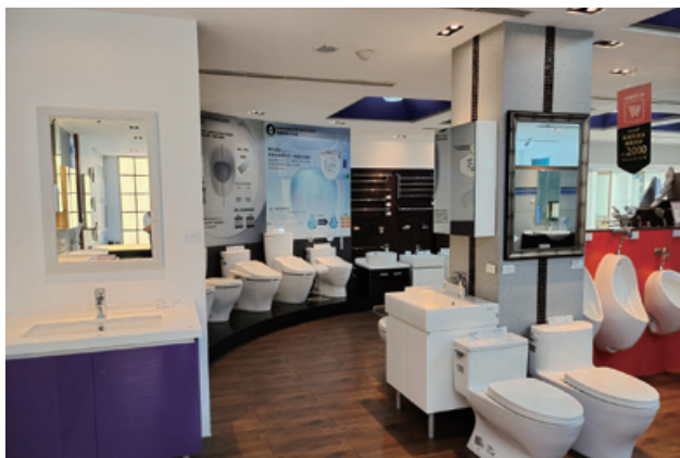
圖 5、馬桶經銷商商品展示