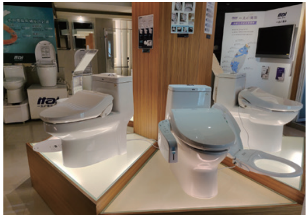
圖 4、馬桶廠商產品展示

實體經銷商包括家樂福、大潤發、愛買、特力屋、全國電子、燦坤、大同等連鎖經銷商，及一般水電行或電器行等一般經銷商，近年來水利署持續針對各縣市之連鎖經銷商與一般經銷商，採隨機方式辦理應具省水標章稽查，查核其展售之應具省水標章產品，是否取得省水標章使用許可。