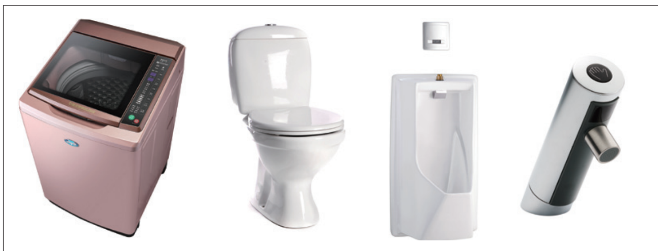
圖 1、已公告應具省水標章之產品

現行行水標章產品計11項，已公告應具省水標章之產品包括洗衣機、一段式省水馬桶、兩段式省水馬桶、沖水小便器及感應式水龍頭等五項。