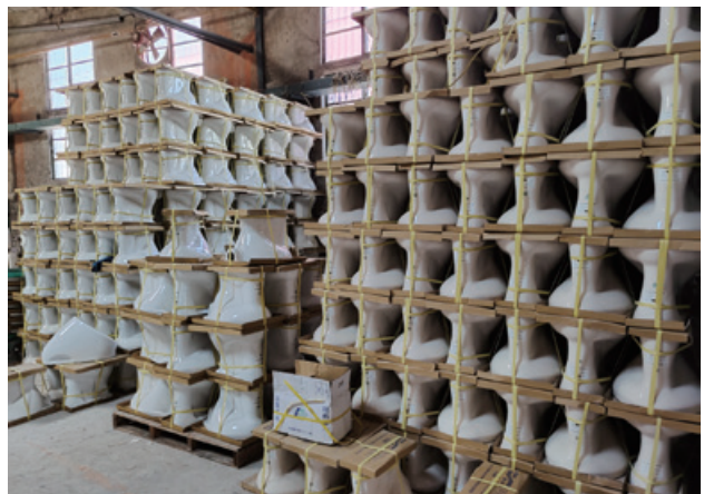
圖 3、馬桶廠商倉儲示意圖

製造商或代理商括洗衣機、馬桶、沖水小便器及感應式水龍頭(111年7月1日起)等之製造商或代理商，查核廠商之倉儲、型錄或官網是否有未具省水標章之產品。