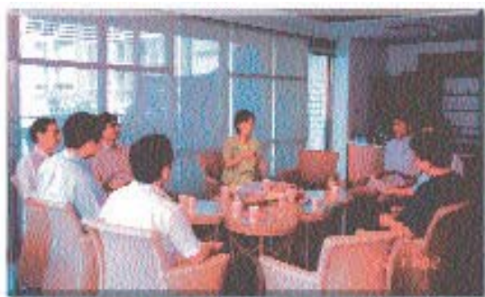
▲ 台灣溫泉研究發展中心訪談現場

溫泉在台灣存在已久問題也積習已久，一瞬間崛起，是否能在民眾日益重視休閒養生觀念、業者投入意願高漲、政府納入管理與推動發展及學界研究界跨足之際趁勢而為，有如溫泉的熱度般，成為最閃亮且永續發展的明星水產業？這將是個最關鍵的時刻。