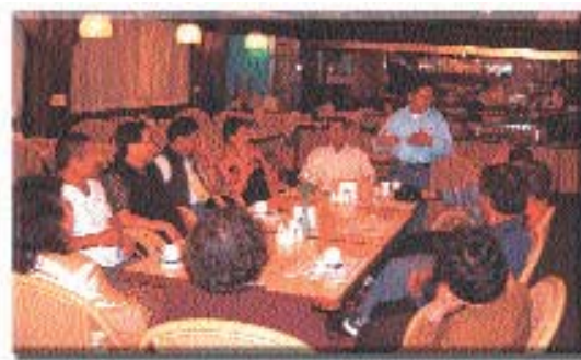
▲ 四重溪觀光發展協會開會情形