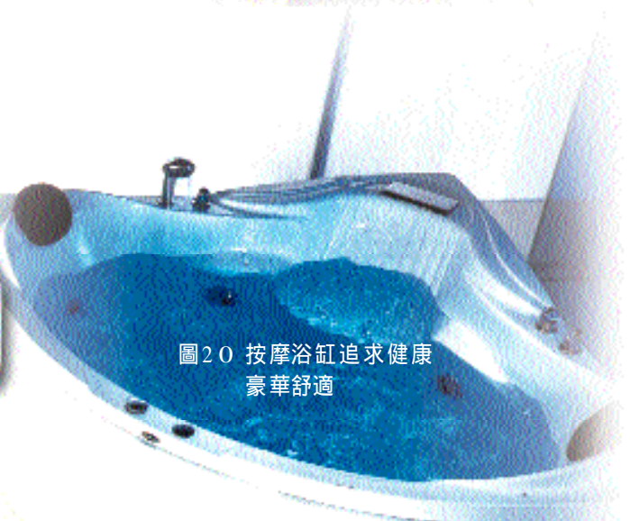
圖 20 按摩浴缸追求健康豪華舒適