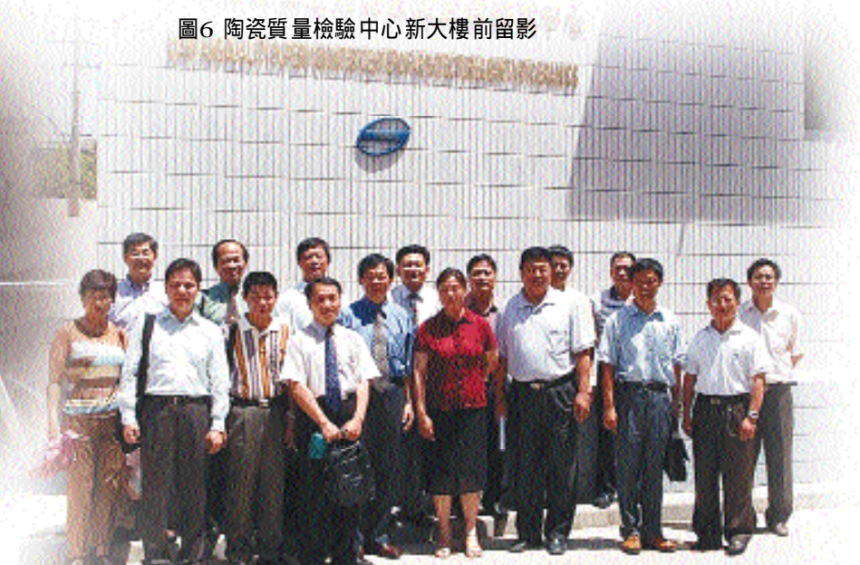
圖6 陶瓷質量檢驗中心新大樓前留影