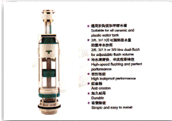
圖 14 馬桶兩段式沖水器朝向直筒上壓式