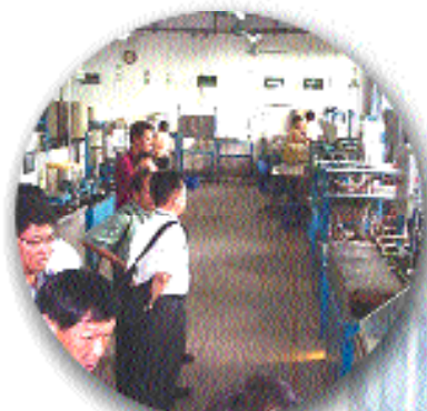
圖9 參觀成霖潔具深圳廠實驗室(1)