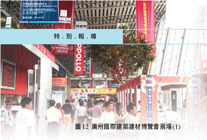
圖 12 廣州國際建築建材博覽會展場(1)