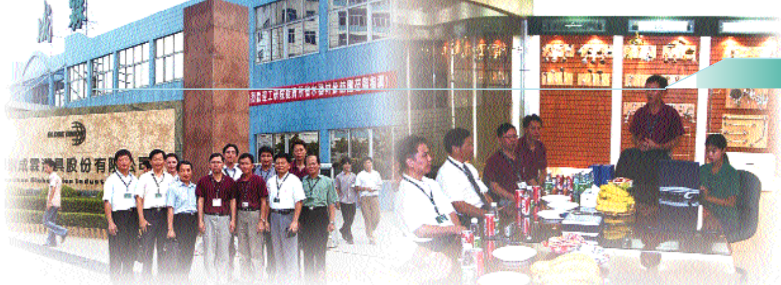
圖7 成霖潔具深圳廠歡迎參訪團來訪

飲用水法案」(Safe Drinking Water Act)，規定美國地區所販售的水龍頭均需通過NSF標準測試，水龍頭出水的含鉛量須低於11PPB。成霖產品能通過如此嚴峻考驗，也為其水龍頭創造了更高的附加價值。