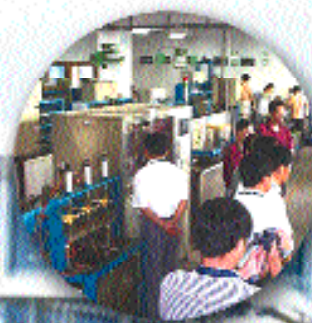
圖10 參觀成霖潔具深圳廠實驗室(2)