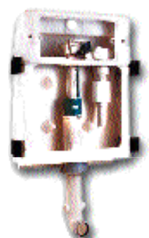
圖 15 馬桶水箱走向輕隔間隱藏式