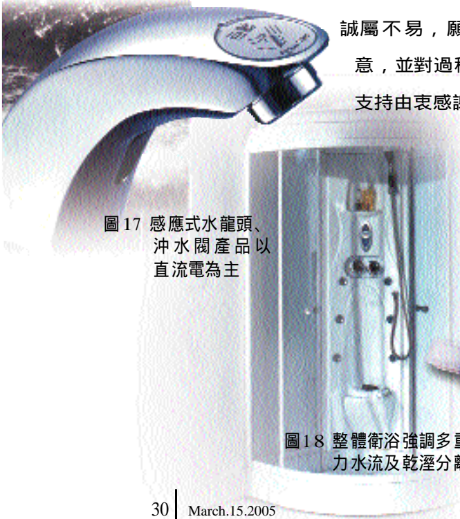
圖 17 感應式水龍頭、沖水閥產品以直流電為主