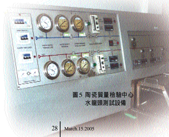
圖5 陶瓷質量檢驗中心水龍頭測試設備

其實，成霖最引以自豪的是其擁有亞洲地區唯一取得美國NSF 61認證之無鉛水龍頭實驗室。由於水龍頭出口品質攸關人體健康，先進國家如美國已於1998年通過「安全