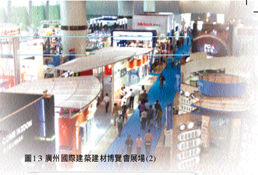
圖 13 廣州國際建築建材博覽會展場(2)