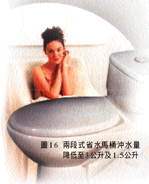
圖 16 兩段式省水馬桶沖水量降低至3公升及1.5公升