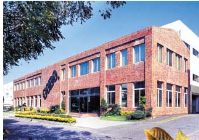
▲ 位於台中潭子加工出口區內之成霖公司外觀