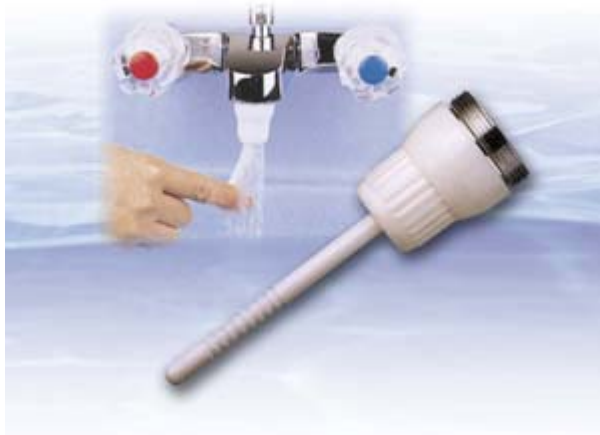
▲ 圖 2 「一指靈」商品

瑩而富公司負責人周孝宗先生從事產品研發多年，不但擁有按壓式蓮蓬頭止水裝置之專利，並將其蓮蓬頭商品取名為「一把抓」，同時申請商標註冊。該產品品質除已通過經濟部