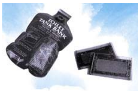
►圖 2 馬桶水箱省水裝置，省水袋(左)及省水隔板(右)