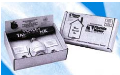
►圖 1 節水換裝組包(Retrofit Kit)之包裝外觀