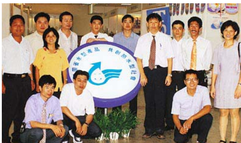
省水器材參展廠商合影

經濟部水資源局為提高省水標章標誌之能見度，除積極針對一般消費者舉辦各項展示活動外，此次並藉配合 7 月 5 日、6 日兩天舉辦第 11 屆水利工程研討會及台大水工試驗所成立 50 週年慶同時，特別於台大第二活動中心舉辦「省水器材展示會」，希望讓平日埋首從事水利工程研究的教授與學生們，也能了解目前省水器材發展的趨勢。此項活動由節水服務團負責籌劃，並邀請省水標章廠商共同參與，希望藉由整體規劃營造省水標章廠商團結形象，總計參與展示活動的省水器材廠商包括台灣東陶、和成欣業、歌林、德久等共 17 家，不但配合意願高，且活動期間每個攤位都有專人負責解說，廠商對展示場地的佈置及間隔等規劃均相當滿意，也對政府積極協助廠商推動省水器材表示感激。然而，稍嫌美中不足之處在於展示場所並非人潮聚集地區，參觀人數不如預期踴躍，顯示出國人對水資源的關心有待進一步提升，主辦單位未來對展場地點的選擇會更加謹慎，展示內容也將加強創新生動，參觀對象更加妥善規劃並積極邀請，使展示活動能呈現出更具體的成效。