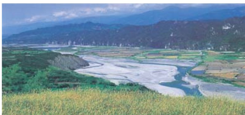
▲卑南溪下游，山里至岩灣段，此段河床寬廣，人們在台地、沙洲上闢地種植作物。

祭師「都巴」(Tuba)與引導水的「都古巴斯」，就到現在的鑾山與嘉豐之間的山上祈禱。