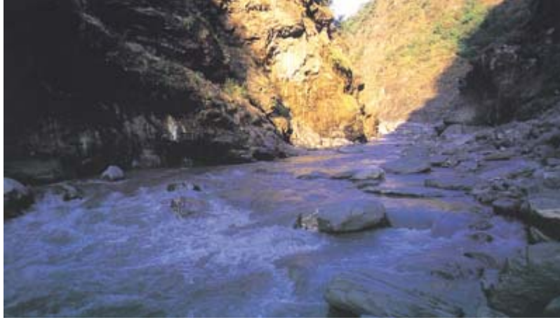
▲鹿野溪發源於中央山脈南段東麓，由許多小支流匯集而成，山高水急，水量充沛。