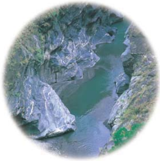
▲鹿野溪為卑南溪水系支流，在上游段河谷大都為堅硬的岩層，經過長久的切割，才能成為大自然的雕刻作品。