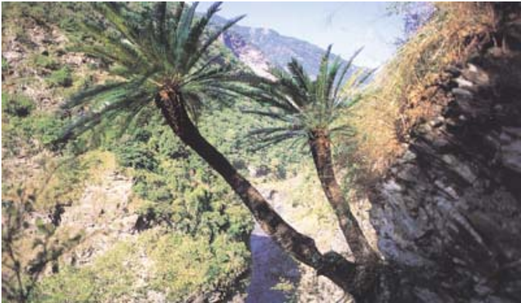
▲鹿野溪上游河谷狹窄岩壁陡峭，處處可見台灣野生種的蘇鐵，樹齡在百年以上，已列為自然保護區。