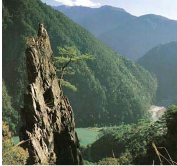
▲ 大甲溪因德基水庫積水之故，自梨山下方至德基段水面較寬平而深遠，在群山包圍中顯出大山大水之勢。

大甲溪得天獨厚，自平等村以西至天冷，水流澎湃、萬馬奔騰，沿途有豐富的景觀資源，像谷關溫泉、十文溪、青山、白鹿和沙蓮等。一路走來，還匯集了 20 幾條支流，包括志樂溪、登仙溪、匹亞桑溪、久良屏溪、石山溪、小雪溪、馬崙溪、鞍馬溪、稍來溪、十文溪、佳保溪、裡冷溪、東卯溪、沙蓮溪、橫流溪、燥坑溪、麻竹坑溪等，其排列組合，猶如一條魚骨。