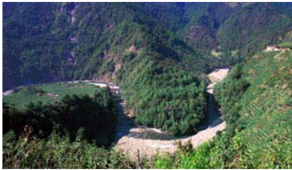
▲ 大甲溪人壽至松茂段，河道漸為平緩，曲流發達，河階台地逐漸出現，這些台地多已被開闢為果園。

德基水庫的下方有青山瀑布群。青山瀑布群位於台中縣和平鄉烏來山(海拔1518公尺)的東北方，屬久良屏溪的下游。由中橫公路穿過青山管制站隧道，在左側深谷中，可以看見一道兩層式的瀑布，常年水量豐沛，水聲轟隆，瀑布兩側俱是深崖絕谷。瀑布的登山口即在大仁橋旁，西面谷關一帶峰巒層疊、時升時降，山稜線條優美分明，霧靄輕擁、如詩如畫。