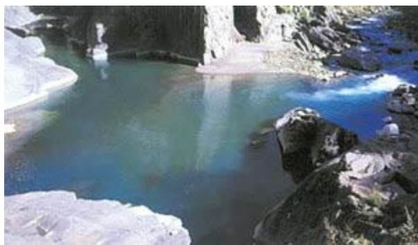
▲ 合歡溪會合南湖溪後水量大增，沖刷力量也大，每至迴彎處，往往形成水凇或深潭，圖為清泉鐵橋下方之深潭景觀。