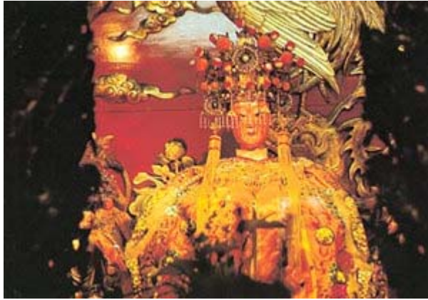
▲ 大甲鎮瀾宮供奉湄洲來的媽祖。

大甲溪在廣闊沖積扇、平原、台地上，撫育和灌溉了無數的埤圳(有清代的葫蘆墩圳、八寶圳、東勢角圳、五福圳)。