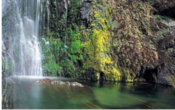
▲ 桃山瀑布涓涓而下，有如垂掛的銀絲。時而日光照耀，浮現彩虹；時而殘葉飄落，構圖詩意。

地形。大甲溪中游佳陽至馬鞍寮河段具有峽谷地形。谷關以下 20 公里間，兩岸較為開闊，河床寬達百公尺，再向下西行約 2 公里抵達馬鞍寮，溪出山嶺，河床寬達 500 公尺以上，流勢漸緩，上游攜帶之砂石紛紛沉積。馬鞍寮起，河流向北行 10 餘公里，叉道分歧，至東勢復向西流至石岡。石岡為大甲溪下游沖積扇的扇頂位置，至此以下迄河口長約 30 公里，流入平原，河寬達數百公尺以上，河床滿佈砂礫與沉積物。