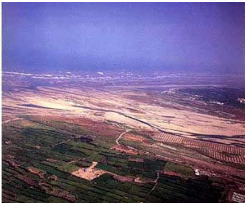
▲ 大甲溪出海口，浩瀚無際，兩岸阡陌良田夾道歡送溪水，回歸大海之懷抱。

青山瀑布後，大甲溪奮力向前，不久即到了龍谷瀑布與谷關溫泉。谷關位於大甲溪中游河段，已進入峽谷區，峽谷內尚殘留少數河階，其中高位河階由沙礫構成，為古河床，低位河階由岩盤構成，河階面多已開發，成為耕地或聚落。溫泉源頭有二，一在舊旅社區吊橋下方，水量甚豐；一在河道上游。龍谷瀑布位於龍谷天然樂園，樂園位於中橫公路谷關入口處，瀑布高約30公尺，瀑布自山壁上傾瀉而下，聲勢浩大。