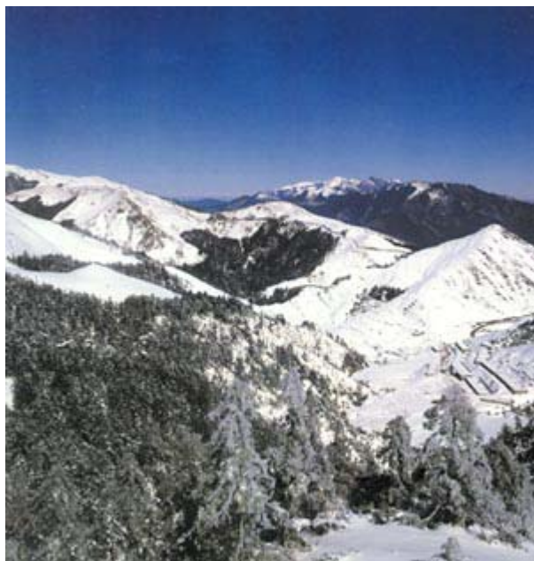
▲ 大甲溪水系支流，合歡溪發源於合歡山北麓，圖中低窪谷地，匯集四周之水源，而形成合歡溪之源頭。

尺處，注入大甲溪主流。司界蘭溪曾是台灣櫻花鉤吻鮭的重要歷史分布河流，也是環山部落泰雅族原住民主要漁獵活動的重要溪流。