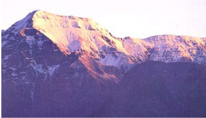
▲ 雪山主峰海拔 3884 公尺，是大甲溪水系七家灣溪司界蘭溪的一處源頭。

大甲溪也是全台水力之冠(擁有 5 個水庫和發電廠)。台中縣域的農田灌溉，主要依靠大甲溪。大甲溪上游地勢陡峻，所以其可供開發之電力可達 1,384,000 瓦，經濟效益宏大。