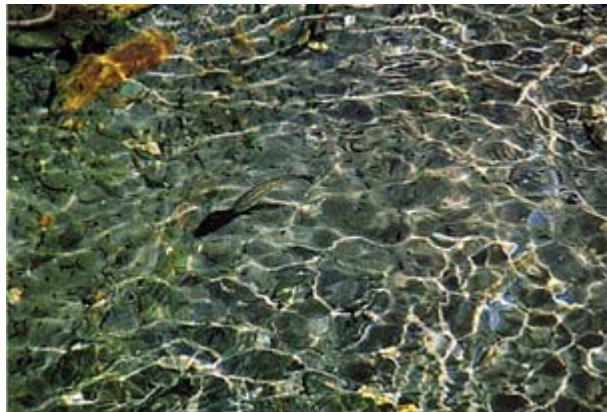
▲ 七家灣溪中的櫻花鉤吻鮭，已受到保護，悠游溪中。

大甲溪上游源流發源於羅葉尾山(2715 公尺)，全長約 11.4 公里，本流最源頭段(思源埡口)位於宜蘭縣大同鄉境內。