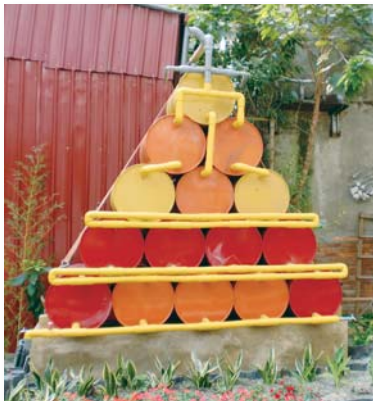
金字塔型的雨撲滿

在全球人口不斷地增加、都市化程度也越來越高的此刻，如何保住珍貴的水資源，是現代人需要面對的課題。今天要跟各位分享，是在台北市區內的社區引用雨水的故事。