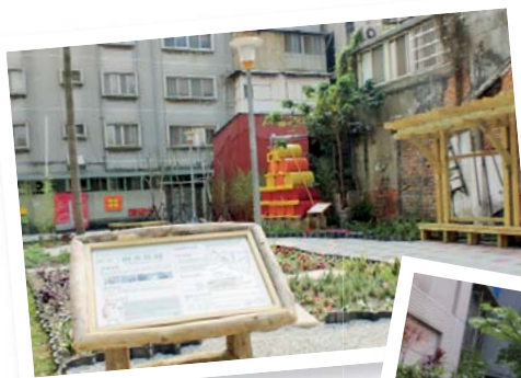
雨水花園完成時的實景