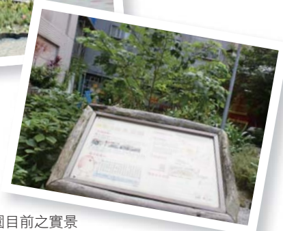
雨水花園目前之實景