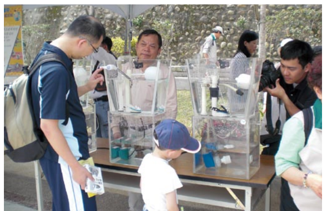
● 民眾親自操作馬桶水箱兩段式沖水裝置