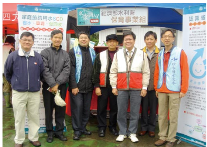
● 陳署長與保育事業組同仁於節水攤位前合影

同時，水利署也特別安排節水宣導攤位，呼籲民眾配合政府推動節水政策，鼓勵多選用省水標章之省水器材。本次宣導活動不但擴大了民眾參與熱度，達到愛護河川，並提升全民珍惜水資源與守護臺灣環境意識之宣導目的。