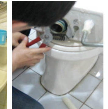
圖五 馬桶水箱換裝兩段式沖水器