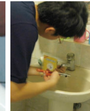
圖四 浴室水龍頭加裝節水墊片