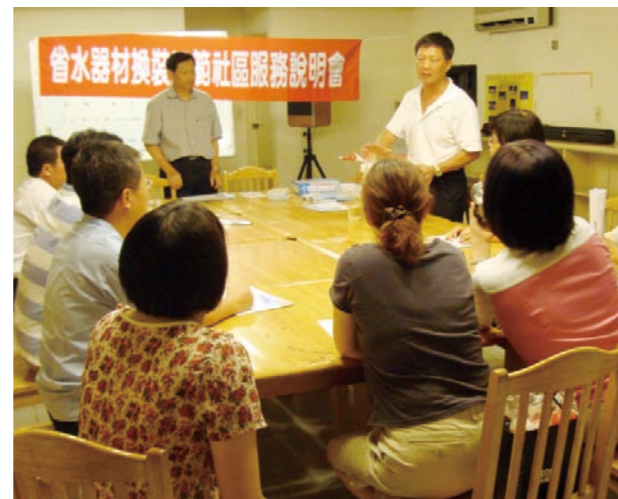
圖一 舉辦換裝服務說明會

社區篩選之優先原則包括1.須100戶以上 2.屋齡須10年以上 3.須先進行住戶換裝意願調查，符合上述原則之社區透過節約用水資訊網報名，總計共八個社區完成申請程序，經甄選評估後，選定桃園市國家都會廣場社區及台南市萬通二期社區做為本次示範社區之對象。