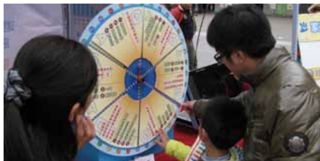
民眾參加闖關遊戲