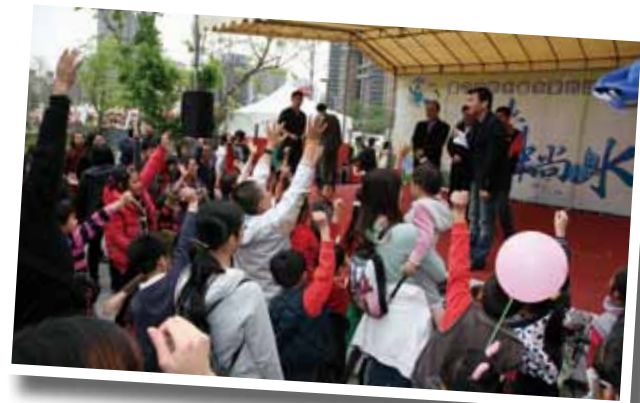
現場民眾踴躍搶答