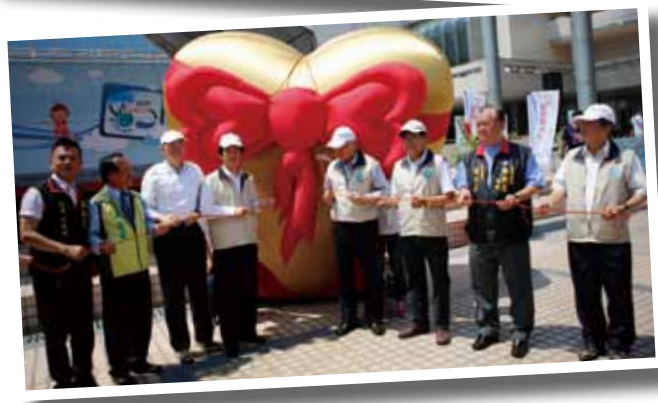
「Hold 住水資源，103 年全民節水日」在臺南市生活美學館