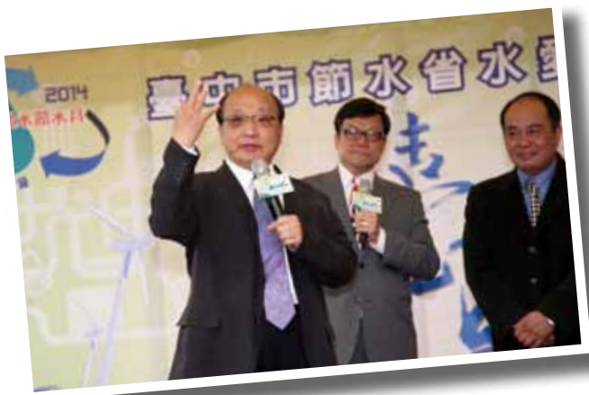
市長胡志強主持摸彩活動

在現場互動遊戲區內，民眾透過互動式觸控螢幕體驗遊戲關卡，以及水龍頭裝置節水設備的 DIY 體驗等，在玩樂中學習知識。