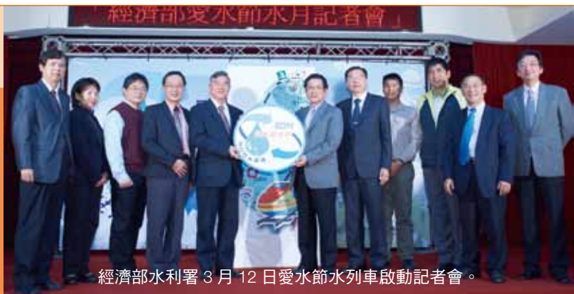
經濟部水利署 3 月 12 日愛水節水列車啟動記者會。