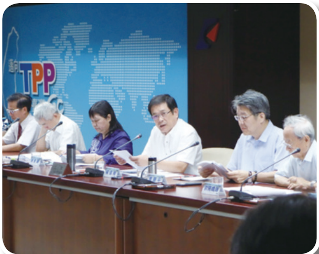
經濟部自來水水價評議委員會

各自來水事業將以「低用水戶保障不調整以照顧基本民生用水」、「調整高用水量費率級距，讓用水越大者，負擔越高的費用」與「用水公平正義」的原則，提報各自之水費調整方案，並由各自來水事業主管機關核定後實施。各自來水事業於推動過程中，經濟部自來水水價評議委員會將適時提供諮詢建議。