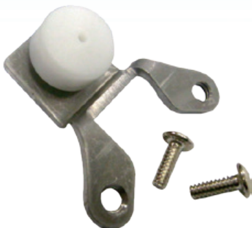
油壓快沖定量省水器