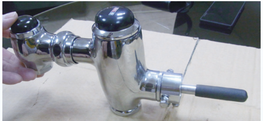
水壓快沖定量省水器 - 安裝位置