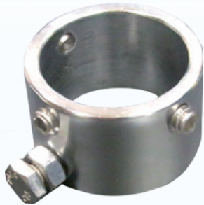
水壓快沖定量省水器

一般馬桶所使用之手押或腳踏式沖水器加裝二段式省水裝置，必須是使用者會選擇踩踏適合的操作桿沖水，才能達成省水功效，一般人進入公廁中都是匆匆忙忙地想儘快離開，常就是腳一踏就離開，無法達到真正省水。一段定量省水器為定量可調式省水器，按壓本體上之踏桿即可。定量可調省水器百分之百能達到省水功能，有別以往二段式省水器，使得其更具實用性。本定量可調式省水器完全符合市面上手押及腳踏式沖水裝置，安裝簡易、方便，可普遍使用於公共衛生場所快沖式沖水裝置上。