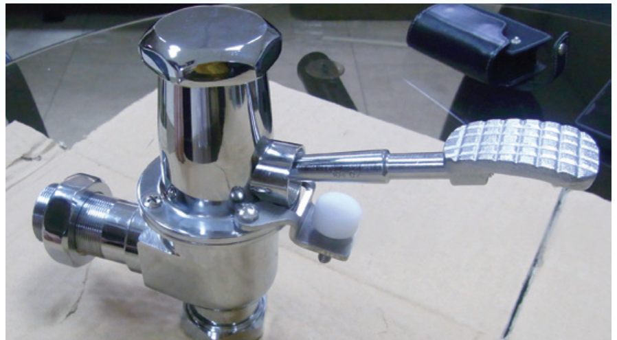
油壓快沖定量省水器 - 安裝位置