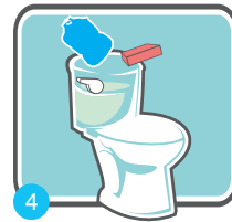
4 舊式大型水箱內置入節水袋、玻璃瓶或磚頭