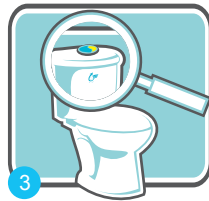
3 換裝兩段式沖水器