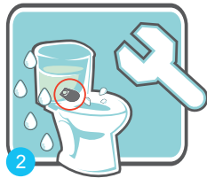
2 檢查與修理馬桶漏水