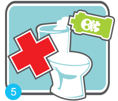
5 不可將腐蝕性清潔液置入馬桶水箱