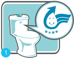
1 換個有省水標章的馬桶